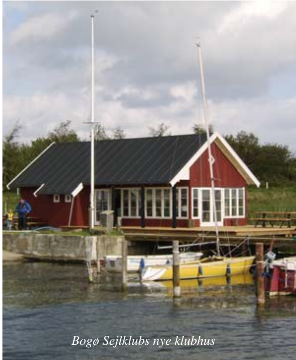
Bogø Sejlklubs nye klubhus