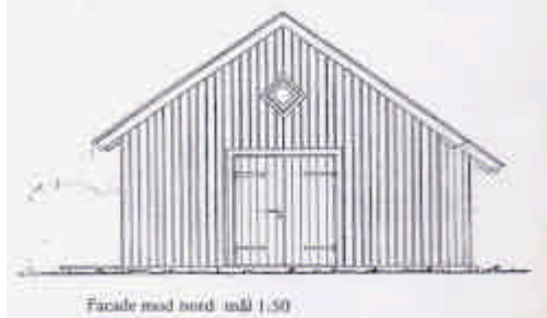
Facade mod nord mål 1:50