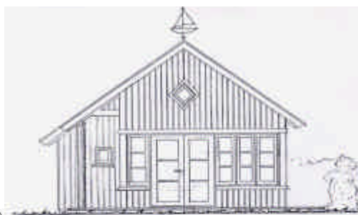
Facade mod syd mål 1:50